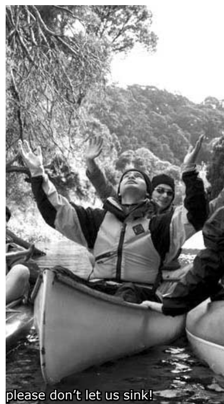
please don't let us sink!