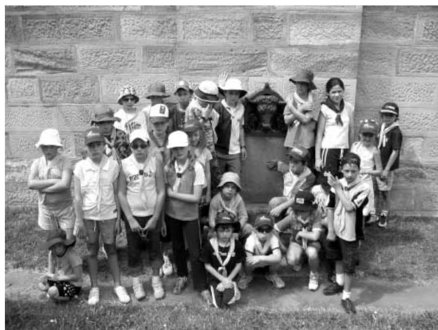
UPN at Berrima Gaol