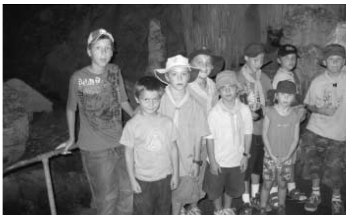
UPN at Wombeyan Caves