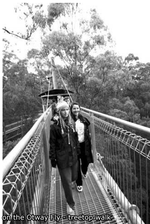
on the Otway Fly - treetop walk