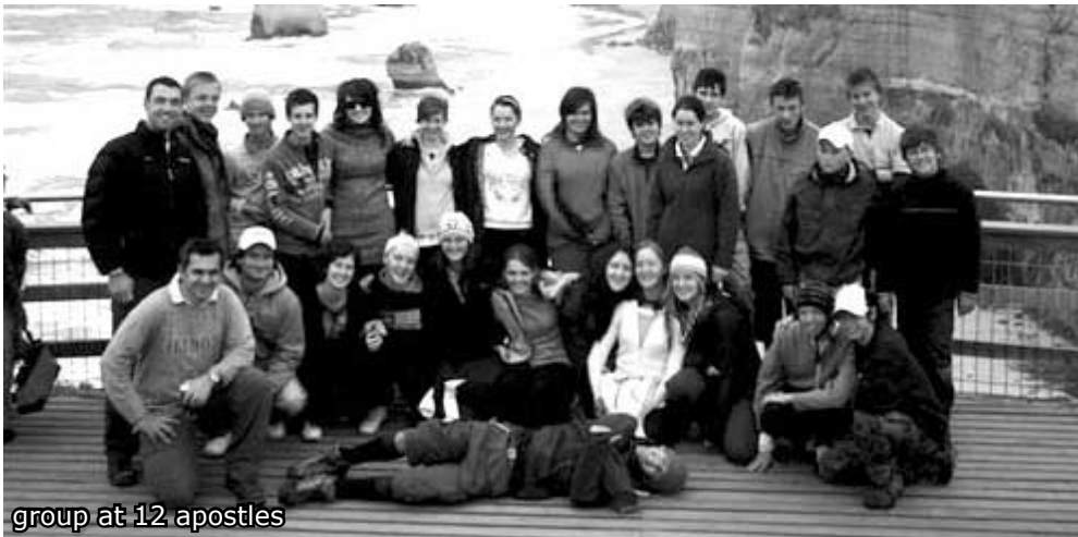
group at 12 apostles