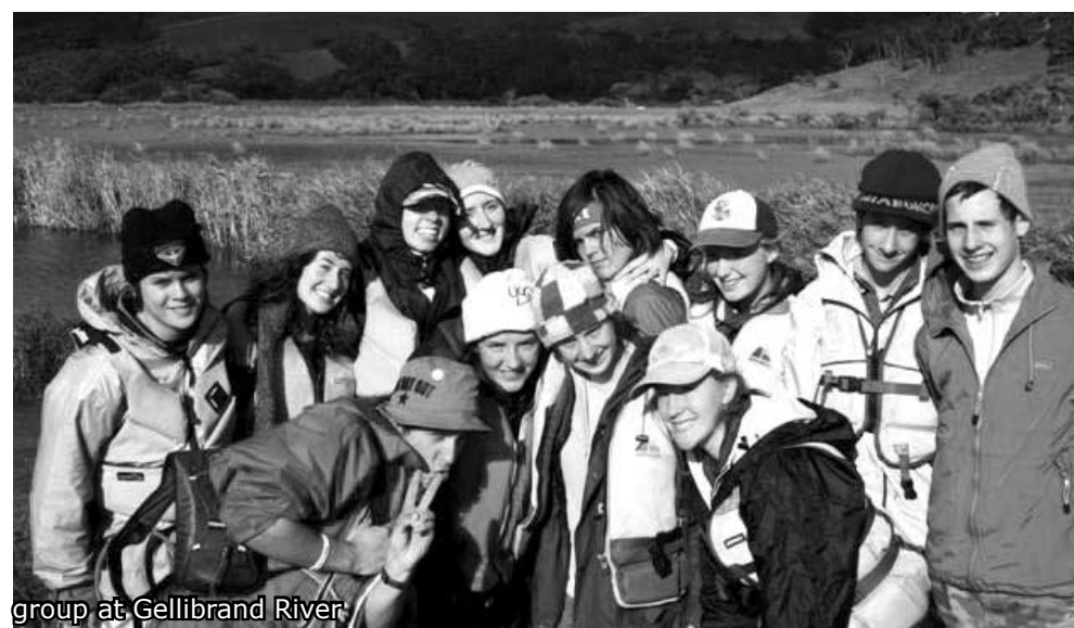
group at Gellibrand River

Gellibrand River and Otway Ranges, Victoria