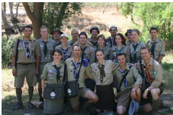
Булави новацьких та юнацьких підтаборів.