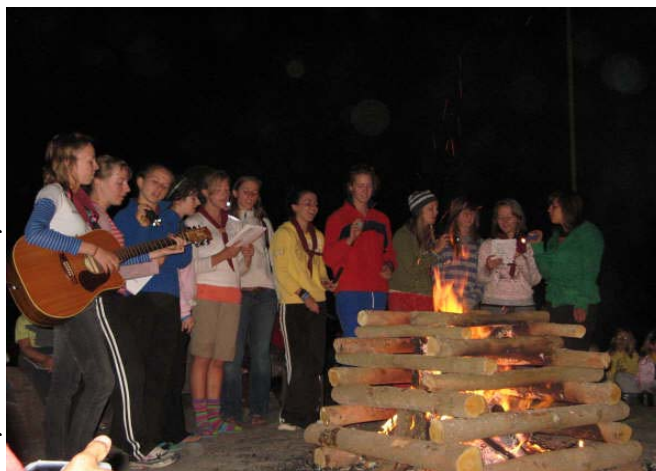
The older girls perform Vodohraj at vatra.

The following days contained as much enthusiasm and were anticipated by all. The most eye-opening and 'whole' encounter was one which created a family atmosphere between all tabir children; Olympiada. This consisted of integrated novatstvo and yunatstvo teams, battling against each other in a round-robin of sporting events. The family feeling continued long into the night (or