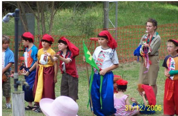
На Відкритий День – Новацтво виступали з монтажем козацького життя.