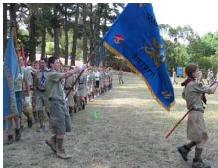
Дефіляда на головній площі

Хоч мети Пласту не змінилися за 95-років, можна сказати, що завдання організації таки мінялися з обставинами, де знаходились себе пластуни. Плекання вірності в