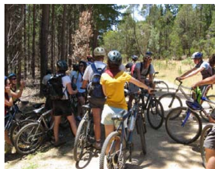
On the bikes...

The next day signalled the end of our bike riding era, but ushered in a night for what was to go down in the pages of history (or better the Plast Providnyk), the inaugural iron chef challenge. Split into various nations, all competitors were left aghast and speechless on the unveiling of the mystery ingredient...SPAM...which was to be the feature ingredient in all three dishes: entrée, main and dessert! Competition was fierce, but in the end, the younger girls prevailed. In spite of this, the surprises did not end at the conclusion of iron chef. Little did we know, but we were all in GRAVE danger, at the merciless peril of the prehistoric brute, colloquially