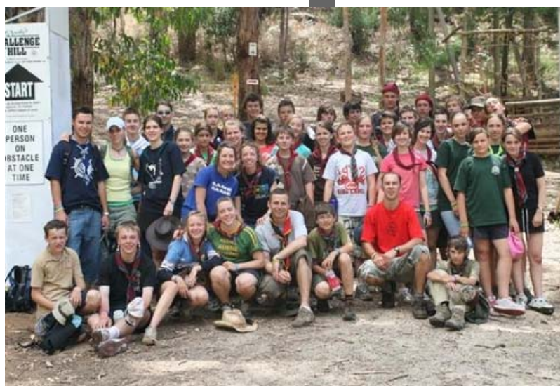
Yunatstvo at Challenge Hill.

While tabir drew to a close the fun times kept rolling in. With keeping with a key theme of tabir: team building, yunatstvo was set more challenges: complete 'Challenge Hill' in one whole bodily piece, with your team also intact, create a skit for vatra, make a masterpiece on a lino print and to