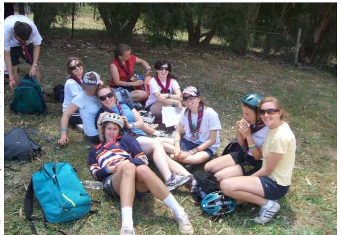
Having a rest during the hike.

We woke the next day to a jam packed 'Pokazovj Den' schedule; an even earlier morning