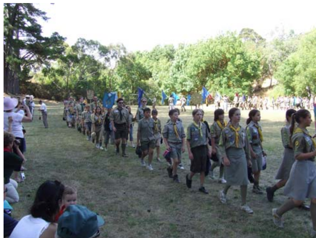
Дефіляда на показовому дні.

Після Богослужінь під стародавніми деревами при річці, що перетинала оселю, учасники підтаборів і гості табору зійшлись на спільний обід-фуршет, також під