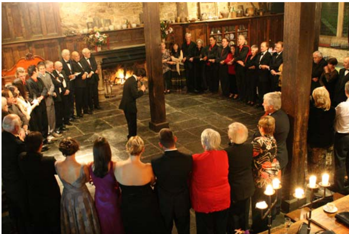
Закриття вечора традиційним пластовим колом і співом “Ніч Вже Йде”