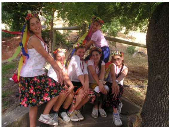
Новачки на показовому дні!