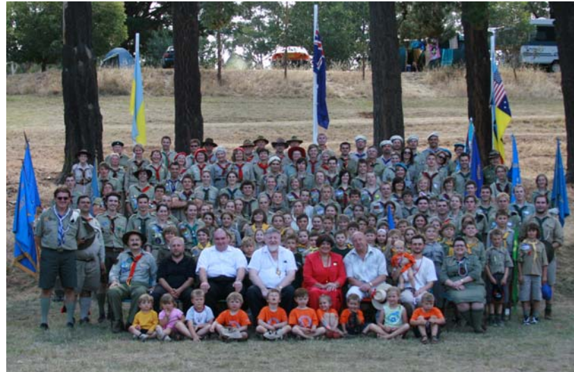
Учасники ЮМПЗ 2006-07 в Аделаїді.

Від 26-ого грудня нещодавнього року до 3-ого січня цього року, пластуни Австралії з'їхались в Південній Австралії відбутися чергову Ювілейну Міжкрайову Пластову Зустріч (ЮМПЗ) з нагоди 95-ліття Пласту. Вже двадцять років прогнали як пластуни приїхали до Аделаїди на крайовий чи міжкрайовий табір. У 1986-87 роках, на пластову площу «Бескид» приїхало 501 учасників з усіх станиць та з поза Австралії. Цього року, ми нарахували десь так 250 учасників табору, та ще 150 додаткових гостей, що приїхали на