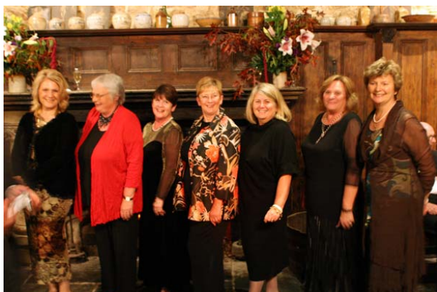
Де не чорти, там же “Відьми”