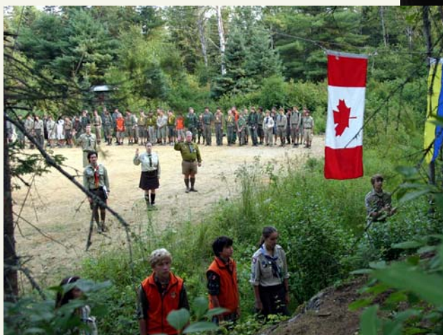
Відкриття табору Учасників першого етапу.