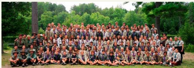
Табір розвідувачів. Перший етап.