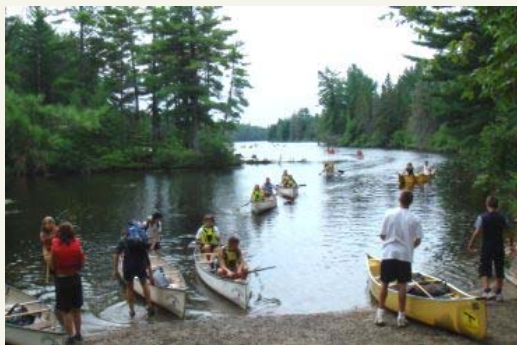
Табір учасників вирушає в каноїках на мандрівку.