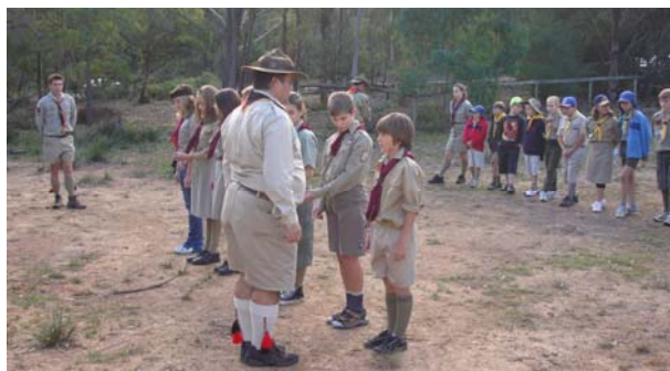
Юнацтво отримує відзнаки ступеня “Прихильник”