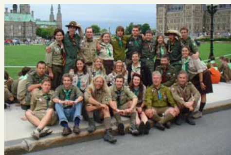
Булава табору учасників в Оттаві, столиці Канади.