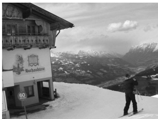
Buchauhutte - the lunch spot

The tabir has taken a near identical form since it's inception. Participants met in Munich, were bussed down to the Austrian town of St Johann im Pongau near Salzburg, and stayed at the Schlosshof chalet. Each morning the entire tabir would take a five minute ride by village transport to the base of the Alpendorf resort, and then catch the gondola 1790 metres above sea level to begin the morning ski lessons with Plast instructors. After a hearty Austrian lunch at the Buchauhutte – a traditional ski hut on the top of the mountain – parents and старші пластуни supervised the afternoon's skiing. On the last day of the tabir, all the participants skied in a Plast slalom championship, and a vatra awards ceremony was held in the evening. Although there were sore legs all around after eight days of dream skiing, everyone was looking forward to doing it all again next year.