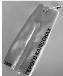
The tabir badge

ст пл Маггі Самер (Бунчужна) із власнуком Бухаугутте