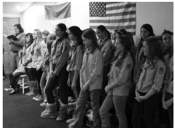
Yunachku at liturgy

Tabir overseas is a fantastic experience, one which I encourage every plastyn/plastynka to take with arms and minds wide open.