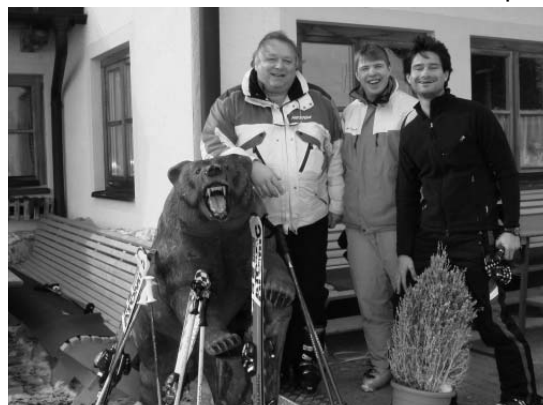
Лижні Лісові Чорти