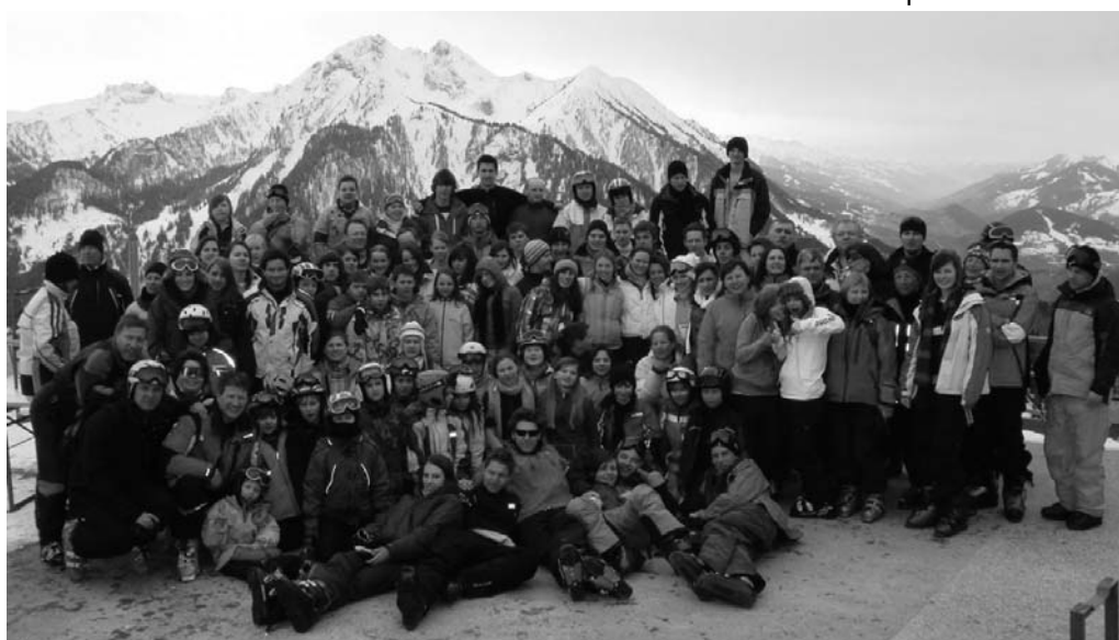
Герої в Калісонах