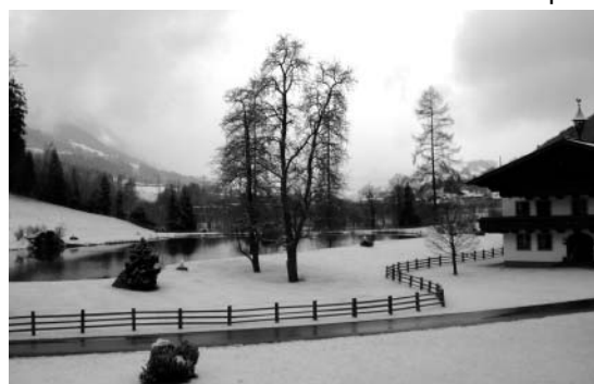
Our village chalet - Schlosshof