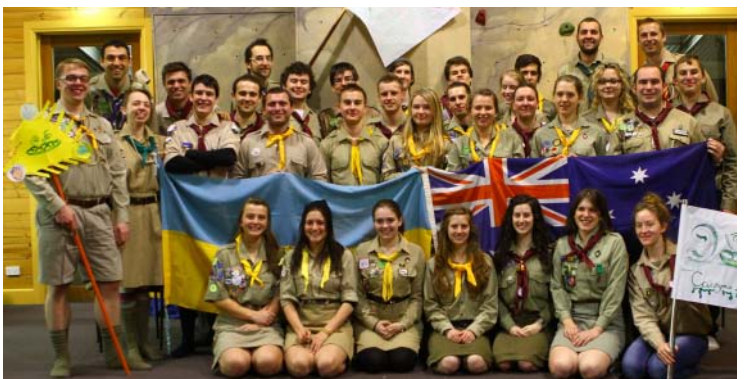
& a whole bunch from all over Australia went to vyshkil