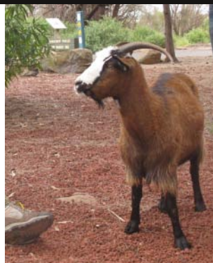
Victoria saw a goat