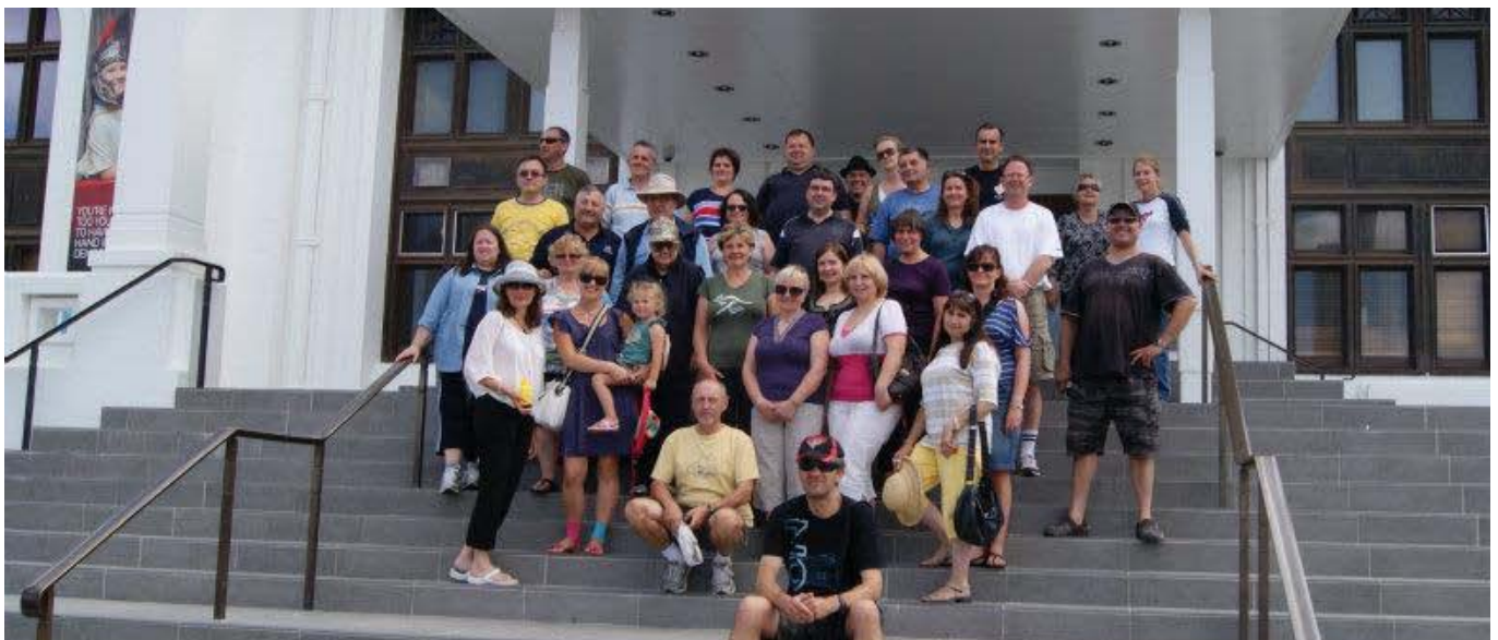
VISITING THE OLD PARLIAMENT HOUSE

A variety of humorous sketches and many songs followed, the words of which were printed in a new