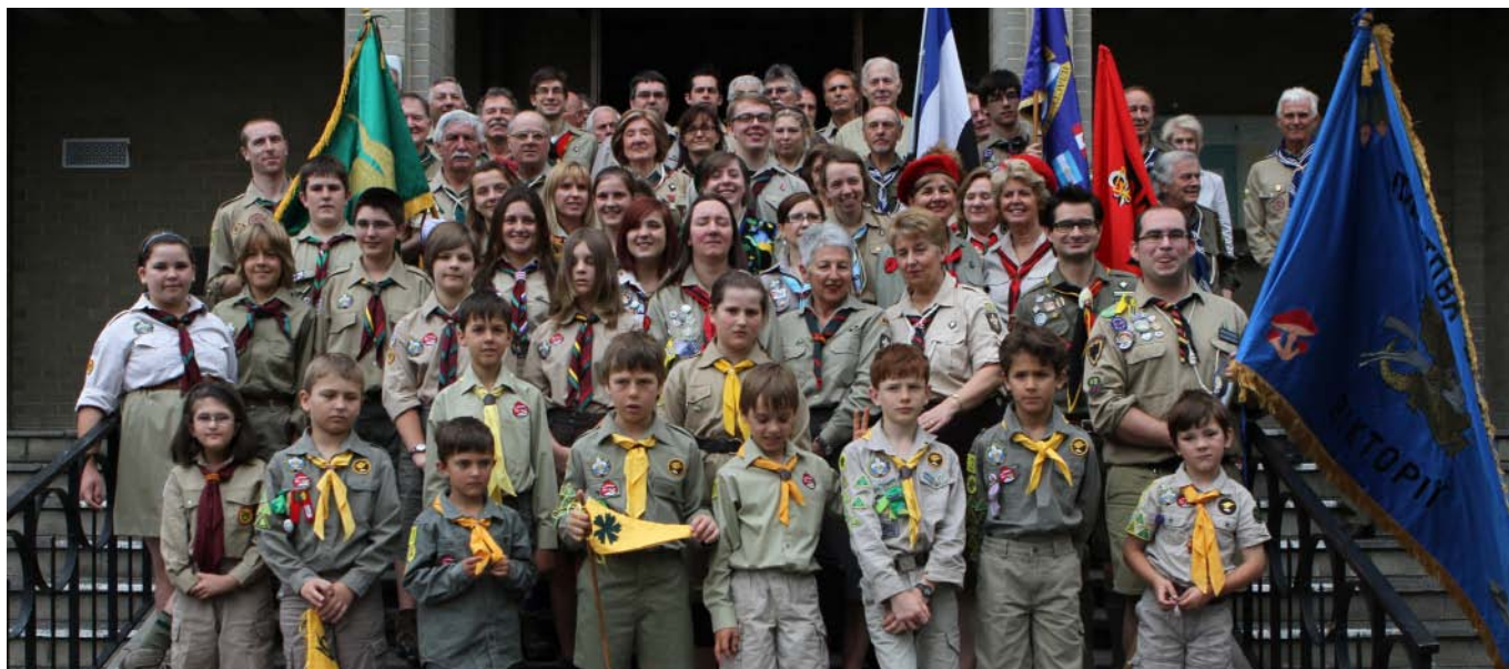
PLASTYNY FROM VICTORIA OUTSIDE THE CATHOLIC CATHEDRAL IN NORTH MELBOURNE AFTER THE BLESSING OF THE 100 LITTIA FLAG