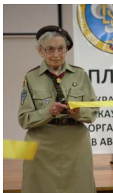
PL SEN OKSANA TERNAWSKA CUTS THE RIBBON TO OPEN THE EXHIBITION