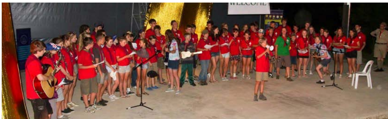
YUNATSTVO, EVENTUAL WINNERS, PERFORMING "ISKRA" AT THE "GOLDEN GUITAR"