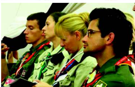
Ст. Пл. Пилип Ботте ЛЧ Голова КПС