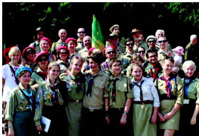
AUSTRALIAN DELEGATION AT THE CLOSING OF UMPZ

Hoverla was a very physically and mentally challenging camp. It included 6 long days of difficult hiking through the beautiful Carpathian mountains. We hiked a total of 135km, which was a huge