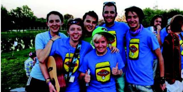
AUSSIES AT UMPZ