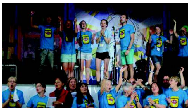
THE AUSTRALIAN GROUP PERFORMS